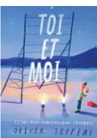
TOI ET MOI Oliver Jeffers