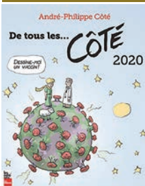
DE TOUS LES CÔTÉS André-Philippe Côté

Du jeudi 17 décembre au samedi 9 janvier, la bibliothèque sera accessible uniquement pour des cueillettes à la porte.