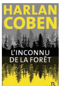
L'INCONNU DE LA FORÊT Harlan Coben