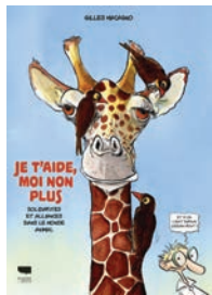
JE T'AIDE, MOI NON PLUS Gilles Macagno